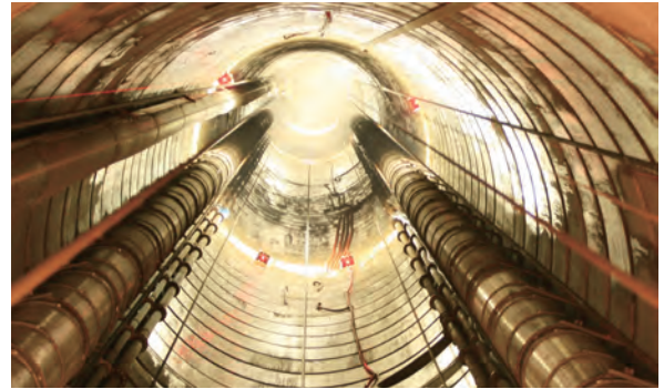
図12-27 主立坑内から地上方向を見上げた状況 直径6.5 mの空間が地上へと続いている状況です。

換気立坑は、昨年度の掘削においては深度約421 m～428 mと深度446 m～453 mの区間を対象にプレグラウチング(坑道掘削に先立ち掘削範囲の周辺の割れ目にセメントミルクを注入する工法)により湧水を抑制しました。湧水抑制対策の要否については、探り削孔により判断しています。深度約400 m～460 m付近は、2006年度に実施したパイロットボーリングの結果において比較的透水性の高い区間 ( 10^{-7} ～ 10^{-6} m/secオーダー) が認められたこ