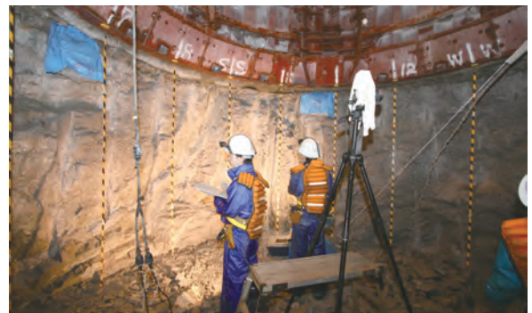
図12-28 換気立坑における壁面観察 換気立坑(直径4.5 m)掘削時における壁面観察の様子です。

とから、2010年度の掘削範囲である深度459.8 m以深においても顕著な湧水が発生する可能性がありました。しかし、探り削孔の結果、深度459.8 m～497.7 m区間で顕著な湧水はないと判断できたので、湧水抑制対策を講じることなく掘削を進めました。