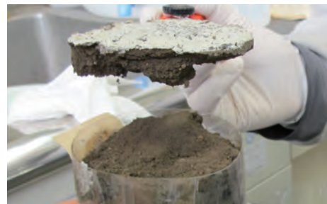
図 7-3 ポリイオンを用いた土壌表面固化技術の開発

2011年3月15日から16日にかけての放射性核種の大気拡散過程を推定したものを示します。発電所（☆）から北西方向で検出された高い線量率と良く一致しています。