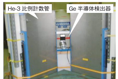
図12-30 NWASの外観・内側 中性子検出器の高さはドラム缶と同等です。Ge半導体検出器は中性子検出器の間に配置されます。

人形峠環境技術センターでは核燃料施設で発生するウラン廃棄物測定のためのNDA（非破壊分析）装置（NWAS：Ningyo Waste Assay System）の開発を行っています。検出器は16本の中性子測定用ヘリウム-3比例計数管で、 \gamma 線測定用としても高純度Ge半導体検出器を併置しています（図12-29、図12-30）。