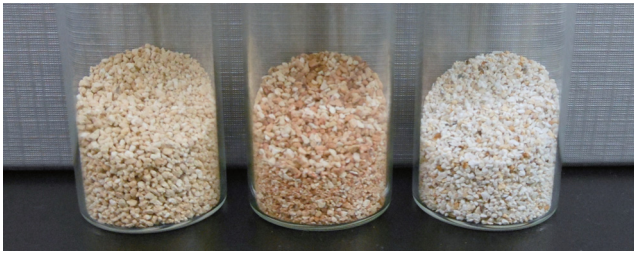
図1-48 実験に用いたゼオライト吸着剤 水素発生量の測定に用いた三種類のゼオライト吸着剤(左から、ゼオライトH, ゼオライトEH, モルデナイト)の外観を示します。