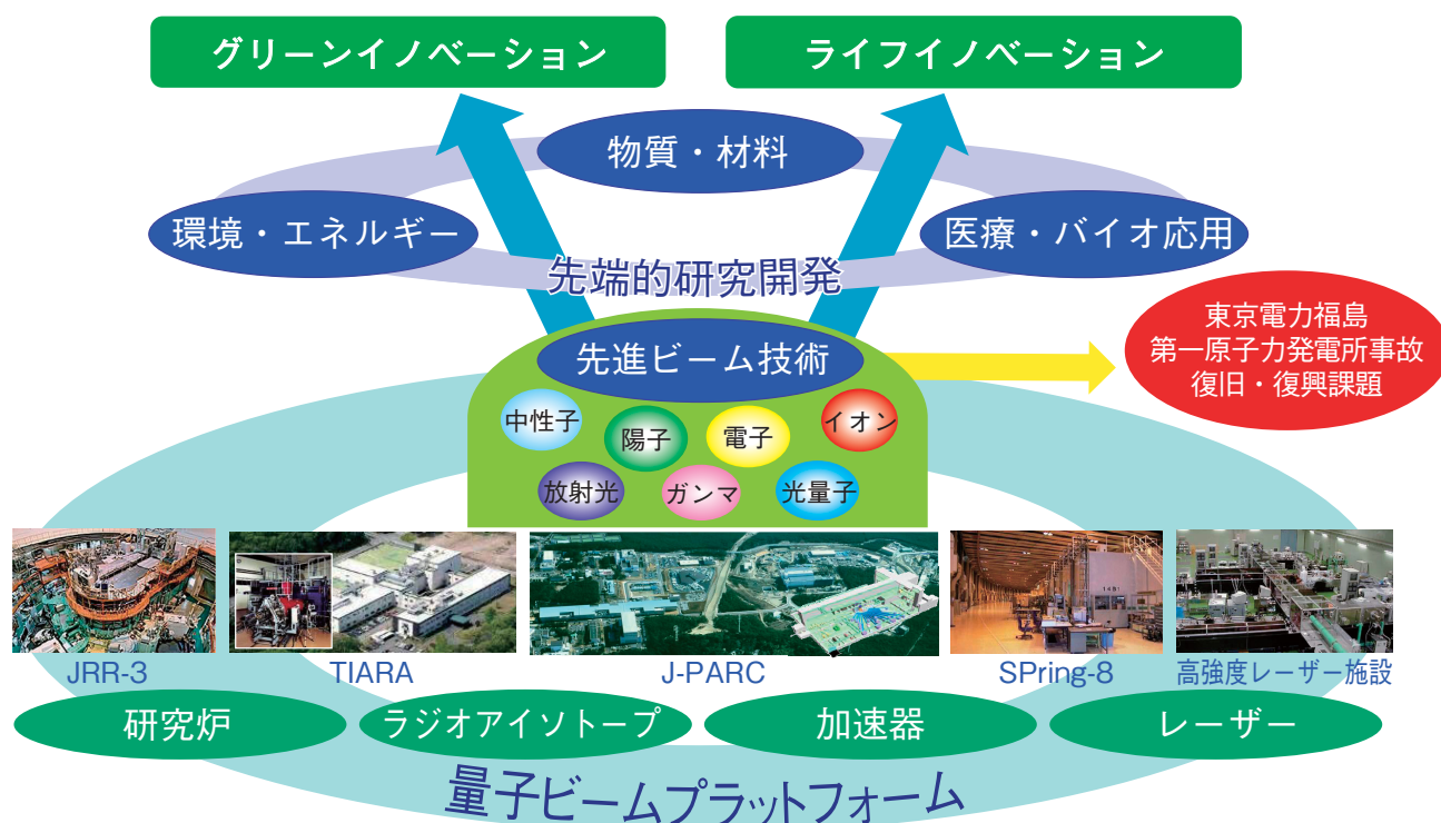
図 5-1 原子力機構の量子ビーム施設群と研究開発分野

加速器、高出力レーザー装置、研究用原子炉等の施設・設備を用いて得られる、高強度で高品位な中性子ビーム、イオンビーム、電子線、高強度レーザー、放射光等を総称して「量子ビーム」と呼び、これらを発生・制御する技術とこれらを用いて高精度な加工や観察等を行う利用技術からなる「量子ビームテクノロジー」が近年大きく進展しています。