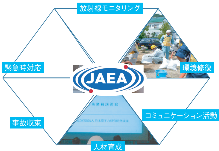
図 1-1 私たちが福島復興に向けて取り組んでいる主な活動 原子力機構福島技術本部のホームページです。 ( http://www.jaea.go.jp/fukushima/ )