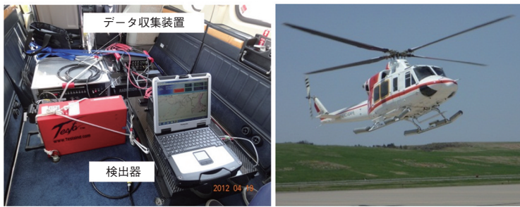
図 1-11 航空機モニタリング機器

航空機モニタリング機器は、大型のNaI検出器の計数率とGPSによる位置情報を同期させたデータを1秒毎に保存する装置です。現在の位置情報をリアルタイムにコンピュータに表示させることも可能です。