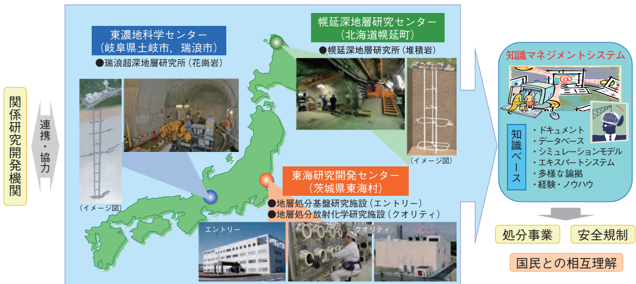
図 3-2 地層処分技術に関する研究開発

安全で安心な地層処分の実現に向けて、私たちは研究開発を着実に進めると同時に、分かりやすい情報の発信や研究施設の公開などを通じて、地層処分に関する相互理解の促進にも努めていきます。