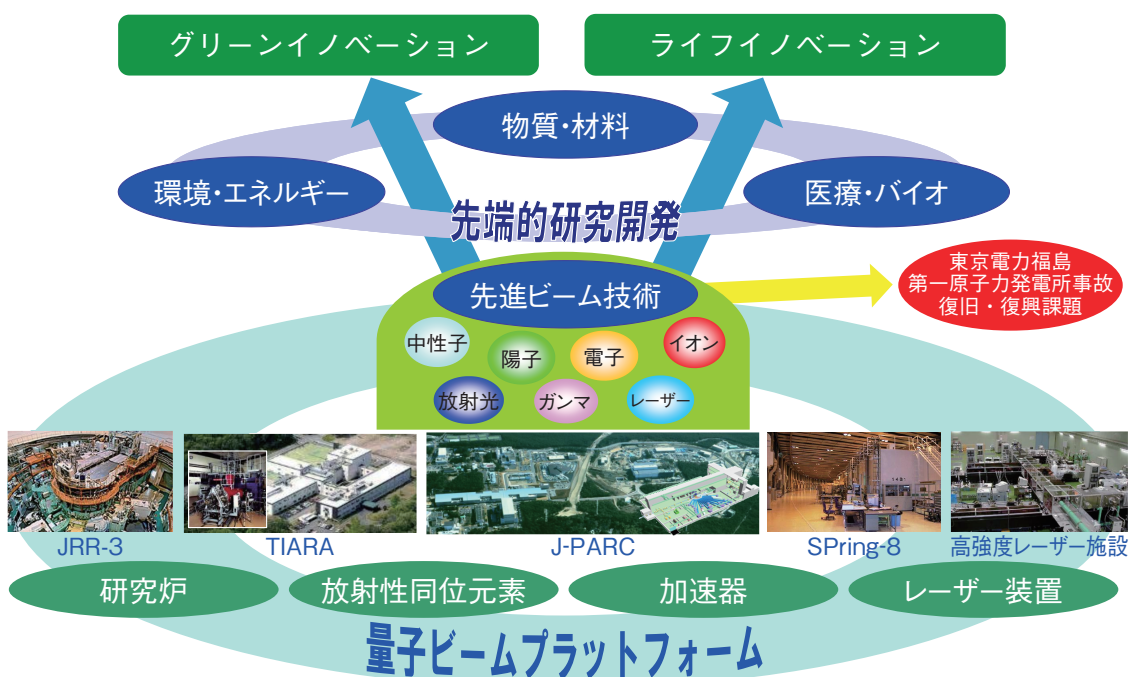
図5-2 原子力機構の量子ビーム施設群と研究開発分野