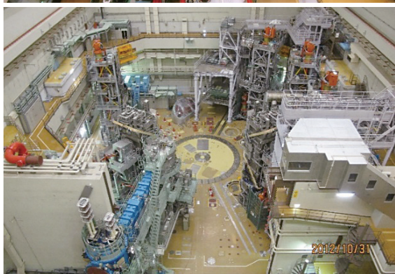
図9-14 JT-60 解体後の本体室

JT-60 トカマク本体を中心に本体付帯設備、計測装置、加熱装置等の周辺設備があり、狭隘複雑な空間を形成しています。