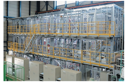
横 18.5 m × 縦 5 m × 高さ 8.1 m