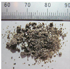
図1-20 福島県内で広く見られる粘土鉱物パーミキュライト