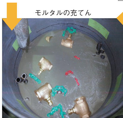
図8-8 模擬廃棄物の組成，セメントの充てん，硬化後の空隙率 模擬廃棄物をドラム缶に収納して、モルタルを充てんし、モルタルの硬化後に空隙率を評価しました。