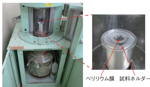
図1-20 低エネルギー光子検出器 (Ge-LEPS) 検出器入射窓は薄いベリリウム膜であり、低エネルギーの光子 (γ線) を高効率で測定可能です。