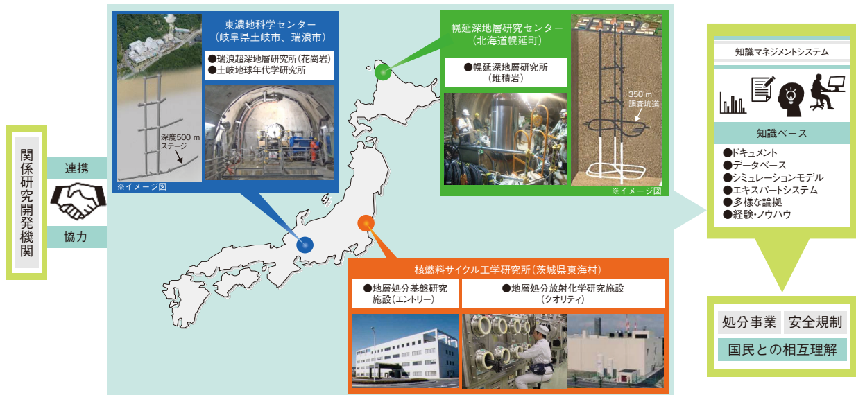
図8-3 地層処分技術に関する研究開発の実施体制と成果の反映先

また、これまでの研究開発成果は知識マネジメントシステムを用いた知識ベースとして体系的に管理・継承していくため、ウェブを活用したレポートシステム（CoolRep）として公開しています。（CoolRep: https://kms1.jaea.go.jp/CoolRep/index.html ）