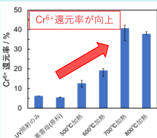
UV-Cを4時間照射後の六価クロムの還元率