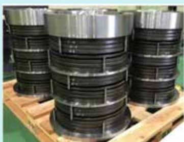
皿ばねユニット（上下免震）