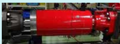
オイルダンパ（上下減衰）